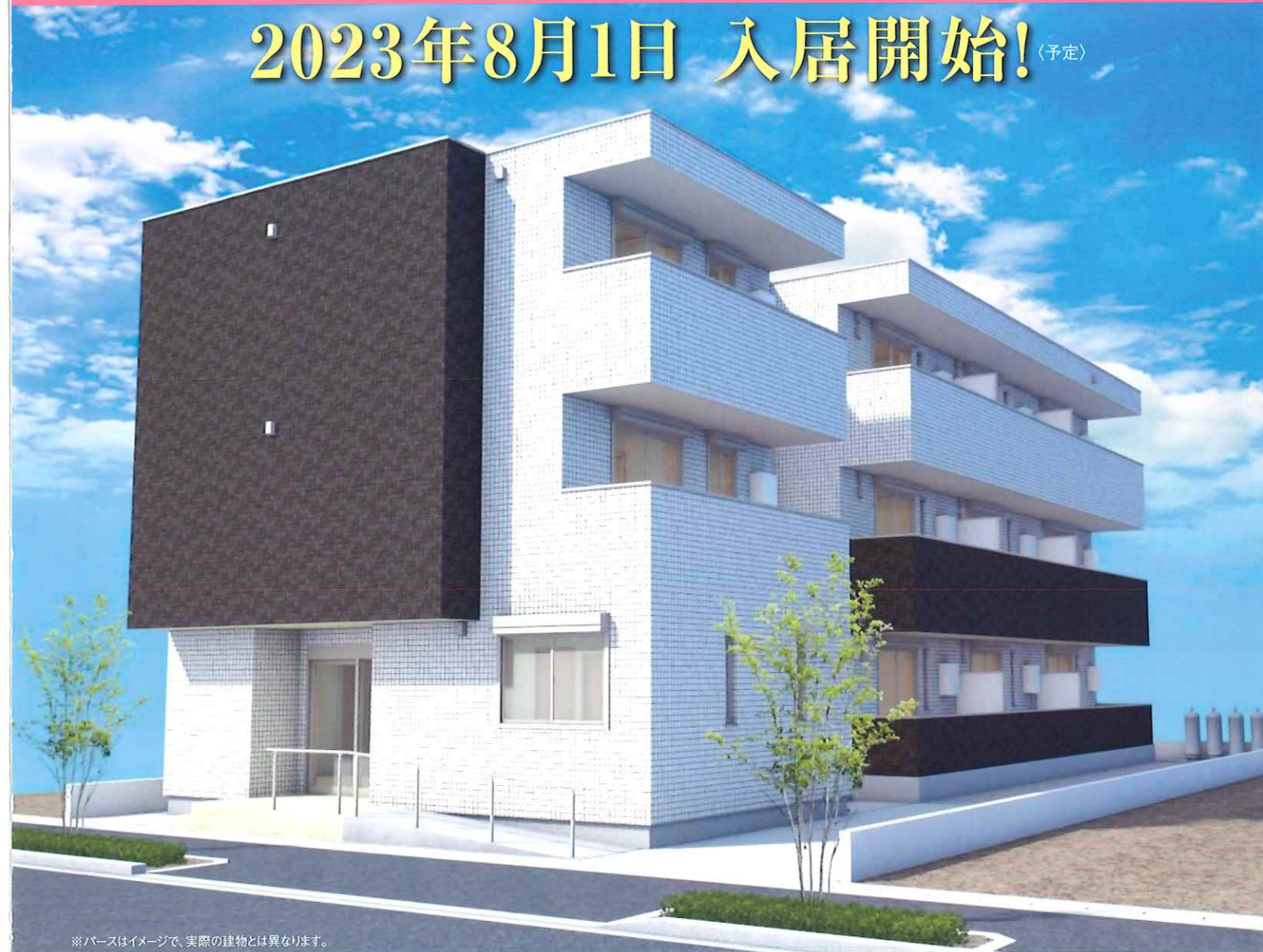
※パースはイメージで、実際の建物とは異なります。