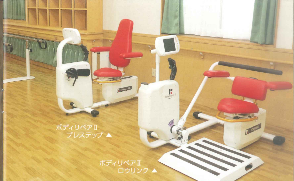
ボディリペアⅡ プレステップ ▲